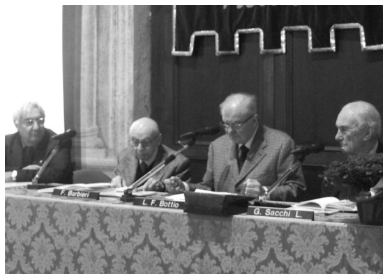
Alcuni dei relatori al convegno su Gian Giorgio Trissino.

L'umanista vicentino Gian Giorgio Trissino, e in particolare il suo poema epico “L'Italia liberata dai Goti”, è stato al centro del convegno organizzato il 27 gennaio scorso dall'Accademia Olimpica di Vicenza, insieme all'Istituto Veneto di Scienze Lettere ed Arti e all'Istituto Lombardo di Scienze e Lettere. Al di là della scarsa fortuna del poema, pesantemente criticato nei secoli successivi, Trissino pose delle questioni che si riverberarono nei secoli successivi, fino a Manzoni, o addirittura fino alla più stretta modernità. Punto di partenza del convegno, con la presenza di alcuni tra i più noti esperti della letteratura italiana cinquecentesca, è stato il volume di Maurizio Vitale “ L'omerida italico: Gian Giorgio Trissino. Appunti sulla lingua dell'Italia liberata da Goti ”, pubblicato dall'Istituto Veneto.