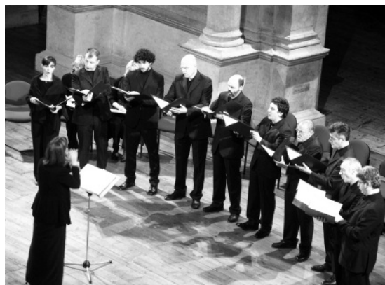
Il "Coenobium vocale" in Teatro Olimpico per la tornata su Asola.

Il quarto centenario della morte del compositore Giovanni Matteo Asola (1528/29-1609) ha offerto l'occasione all'Accademia Olimpica per ricordare il sacerdote veronese, vissuto nel Cinquecento, che fu Maestro di cappella nel Duomo vicentino per un paio d'anni, e che soprattutto si trovò ad dover interpretare e applicare i nuovi dettami liturgici imposti dal Concilio di Trento.