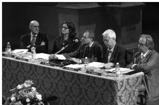
I relatori in una fase del convegno di studi sullo scrittore vicentino.