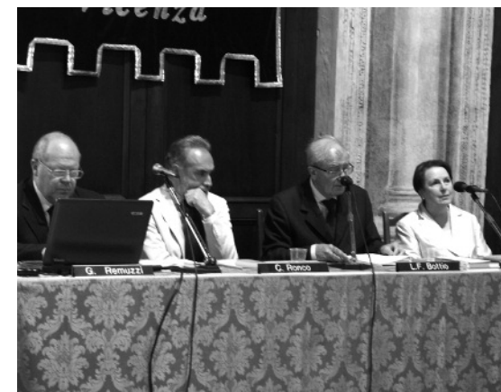
I relatori alla tornata sulle malattie renali e la nefrologia a Vicenza.

Tra i più importanti ricercatori a livello internazionale c'è Giuseppe Remuzzi, degli Ospedali Riuniti di Bergamo-Istituto Mario Negri, intervenuto alla tornata: "Il nostro obiettivo – ha detto – è rallentare la progressione delle disfunzioni renali per allentare il più possibile nel tempo il bisogno di dialisi o di trapianto". La via per riuscirci passa per la riduzione della pressione e della perdita di proteine. Ci sono farmaci che consentono di farlo, ma non per tutte le malattie; nel caso del diabete, ad esempio, occorre agire in via preventiva, monitorando le urine per vedere se c'è perdita di proteine. Ciò permette di avere una finestra