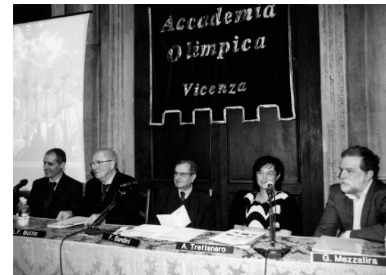
I relatori alla tornata dedicata al congresso di Copenhagen.

Il fattore che maggiormente si teme, tra gli altri, è l'aumento della temperatura, il principale componente dell'effetto serra. I dati ormai consolidati consentono di prevedere conseguenze catastrofiche anche con variazioni apparentemente minime. Se la temperatura dell'aria aumentasse di 1,8 gradi centigradi, il livello dei mari si alzerebbe da 18 a 38 centimetri, arrivando fino a 60 con un aumento di 4 gradi: ci sarebbero profondi sconvolgimenti nelle zone costiere di tutto il mondo. Per questo, sempre a Copenhagen, si è riconosciuto che è indispensabile limitare a un massimo di 2 gradi l'aumento della temperatura fino al 2050.